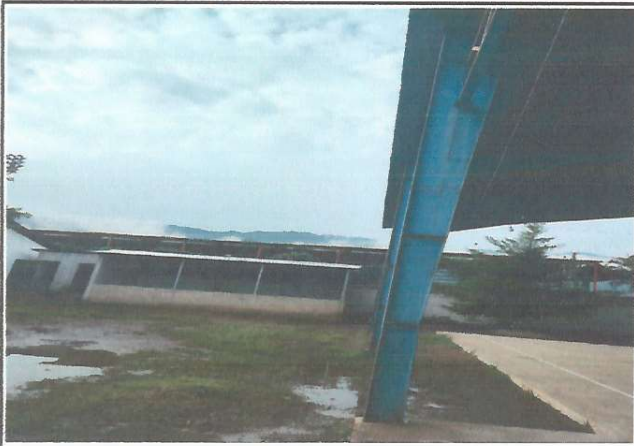
Foto1: COLOCACION DE CANALES PARA CAIDAS PLUVIALES