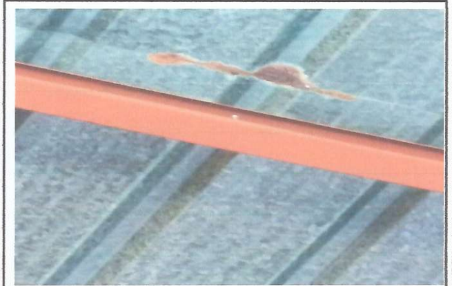
Foto 4: CAMBIO DE LAMINA EN UNA AULA DE LA PARTE FRONTAL DEL ESTABLECIMIENTO

Observación: Si es necesario se pueden agregar hojas adicionales y actualizar el número de hojas.